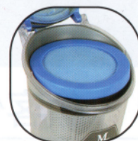
3. 打開集塵桶蓋 向上打開集塵桶蓋 取出濾網並清潔