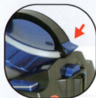
1. 卸下集塵桶 按壓集塵桶卸除鍵 取下集塵桶