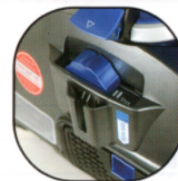
2. 吸力調整Bar 可以左右調整吸力大小