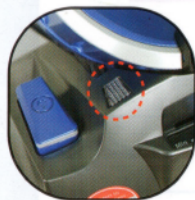
1. 堵塞指示燈 燈亮請檢查管線是否堵塞