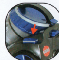
5. 開啟電源 按下電源開關鈕 即可開始吸塵