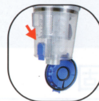
2. 一鍵倒垃圾 輕推集塵桶底蓋開關 傾倒垃圾