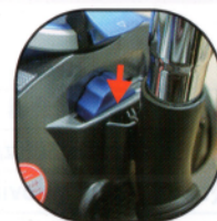
3. 掛地板吸頭 地板吸頭可掛於機身後方