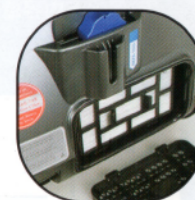
4. 開啟排氣蓋 取出HEPA濾網 用毛刷清理髒汙